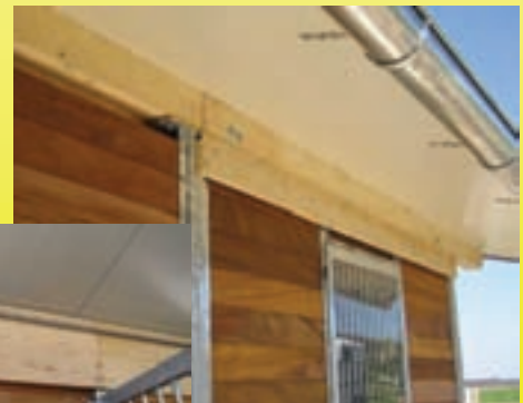
Verschalung der Oberkanten innen und außen.