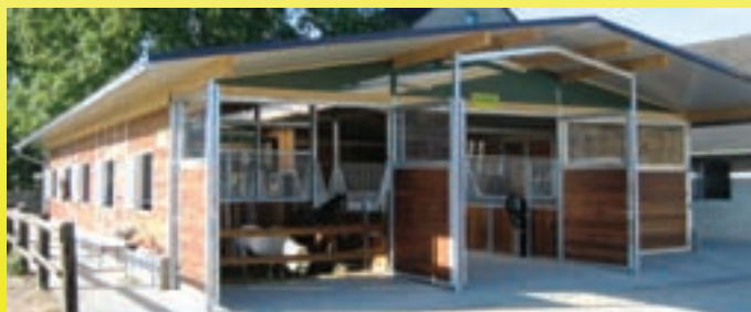
Pferdestall mit herausziehbaren Trennwänden und Toren an der Stirnseite. Giebel mit Windnetzen.