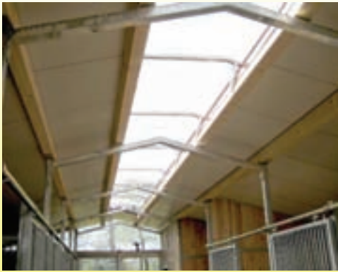
Rhenalux-Lichtfirst in verschiedenen Breiten. Auf Wunsch mit lichtstreuenden Platten.