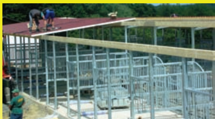
Stall im Aufbau: zuerst werden die Säulen am Fundament angedübelt, dann das Dach und die Boxen montiert und das Holz waagrecht eingelegt.

Wir empfehlen eine Boxengröße von 3,50 m x 3,5 m. Andere Maße sind jedoch problemlos möglich!