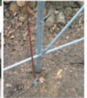
14 Spezialanker (im Preis inkl.)