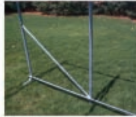
An allen 4 Ecken sind Wind-Verbände angebracht