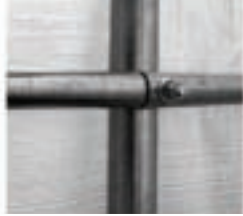
Kein Bohren notwendig