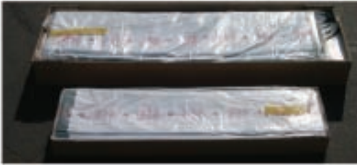
Kunden freundlich verpackt in 6 Kartons