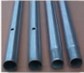
Alle Stahlrohre sind feuerverzinkt