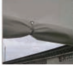
Roll-Up Tor (Sonderzubehör)